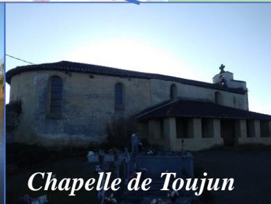
Chapelle de Toujun