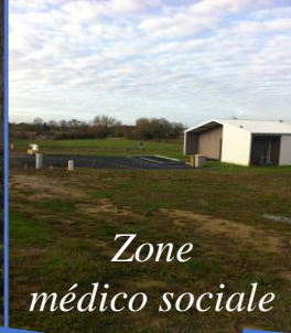
Zone médico sociale