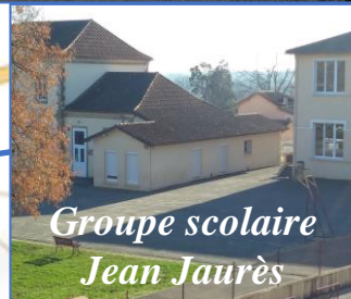
Groupe scolaire Jean Jaurès