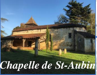
Chapelle de St-Aubin