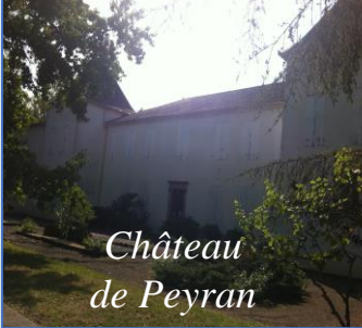
Château de Peyran