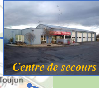
Centre de secours