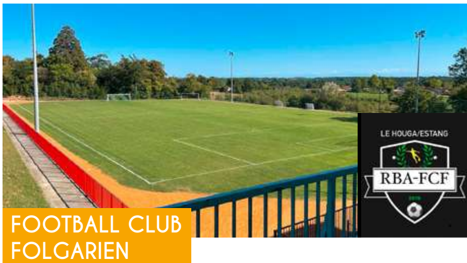
FOOTBALL CLUB FOLGARIEN

Voici maintenant deux ans que le FCF a rejoint le club du RBA FC pour former une entente. Après deux saisons très intéressantes à tous les niveaux, nous repartons cette année avec des équipes supplémentaires et de nouvelles ambitions en espérant pouvoir achever enfin une saison avec une montée au plus haut niveau départemental.