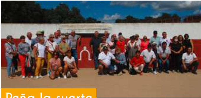
Peña la suerte