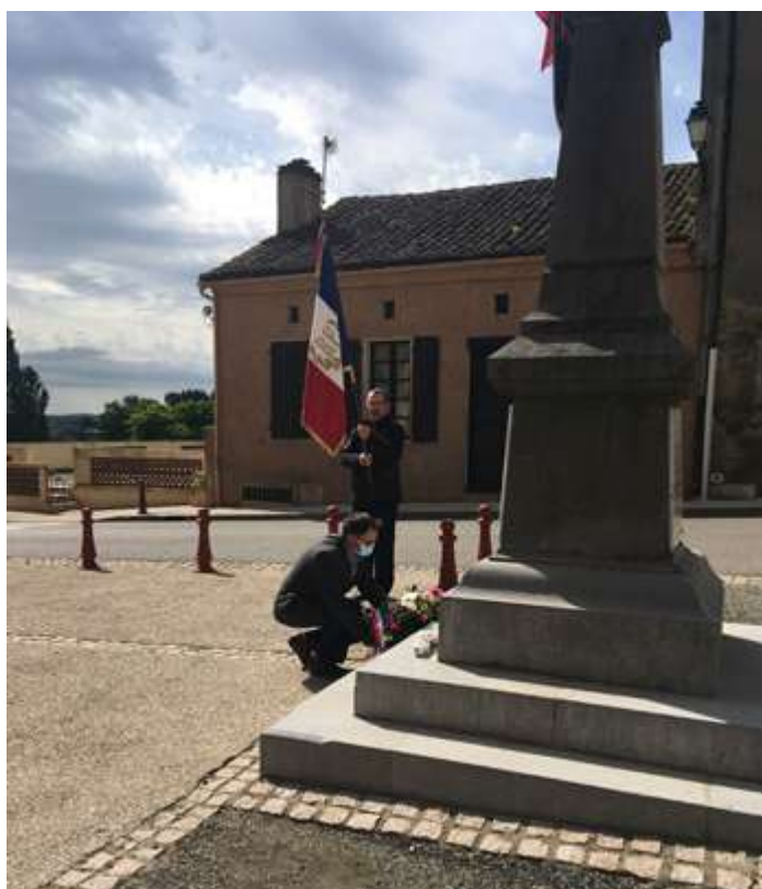
Cérémonie du 8 mai 2020.