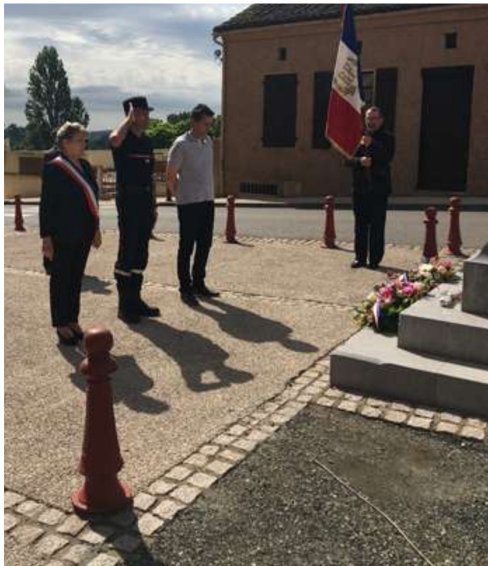
Cérémonie du 8 mai 2020.

En ce mois d'Août 1944, les nazis n'ont plus rien à perdre. Si dans la mémoire collective le massacre d'Oradour sur Glane occupe une place prépondérante, on ne peut occulter l'importance de la sauvagerie d'assassinats collectifs qui endeuillèrent chaque coin de notre pays qui sentait la libération proche.