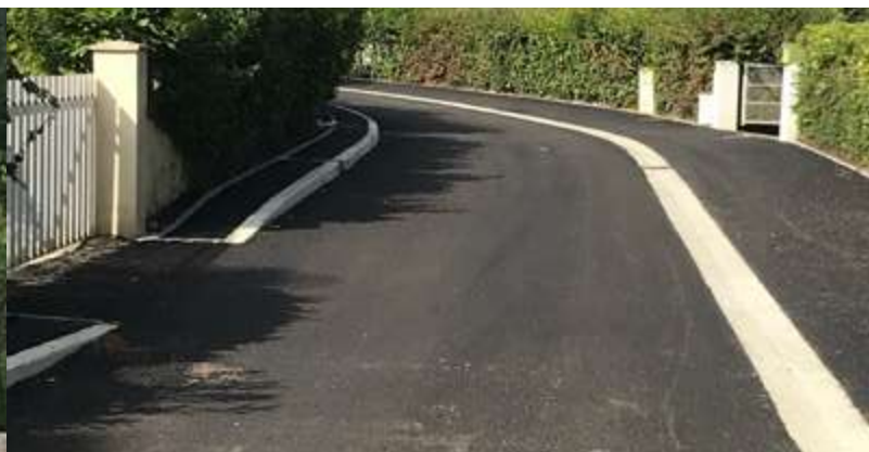
Lotissement les Prunus.