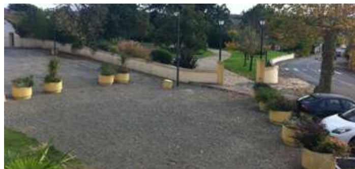
Partie restant à aménager.

L'aménagement global de ce site dépend de l'expertise de professionnels de la DREAL et vise à en préserver la qualité. Ce projet s'élaborera de ce fait en concertation et dans le respect des obligations liées à ce classement.