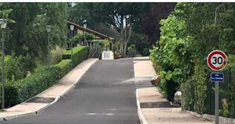
Lotissement Pierre Sauvage.

Terrain de foot : pare ballons et abris de joueurs. L'objectif du précédent mandat est pratiquement atteint concernant la réhabilitation du Complexe sportif. Reste à changer le portail d'accès pompiers pour ce qui concerne le terrain de foot.