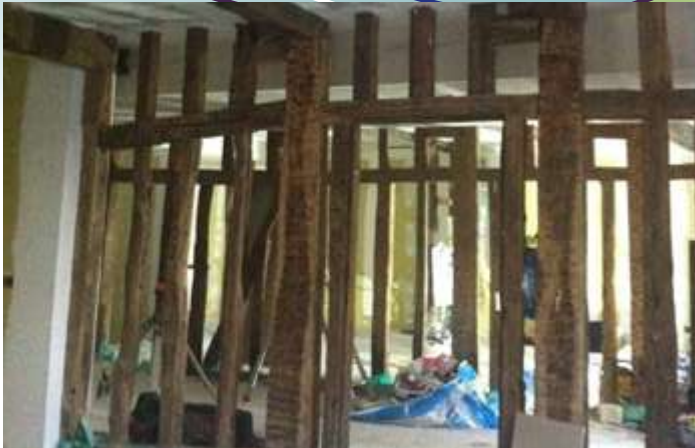
Bâtiment culturel en cours de restauration.