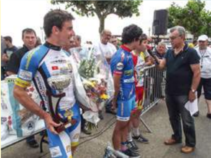
Course cycliste des fêtes de la Saint Pierre.