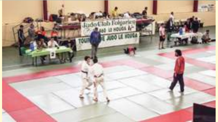
Compétition de judo