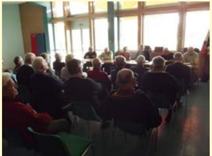
Assemblée Générale des anciens combattants