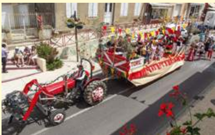
Chars des fêtes de la Saint Pierre