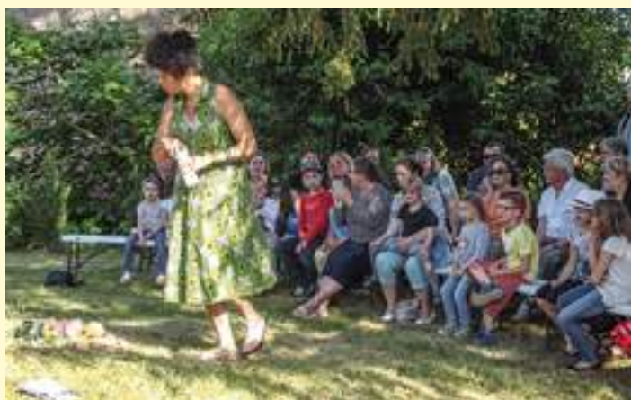
Dire et Lire à l'air